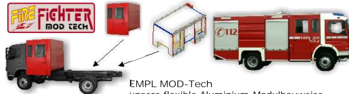
EMPL MOD-Tech unsere flexible Aluminium-Modulbauweise