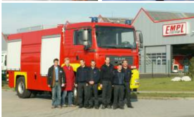
Übergabe eines neuen Feuerwehrfahrzeuges