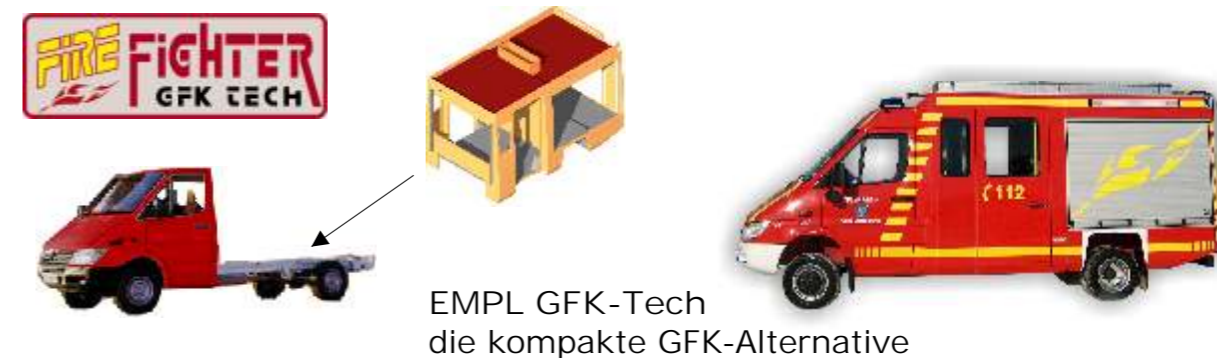
EMPL GFK-Tech die kompakte GFK-Alternative