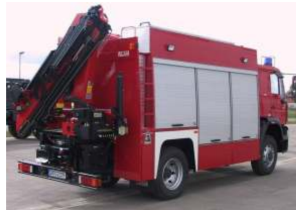
RW mit Kran