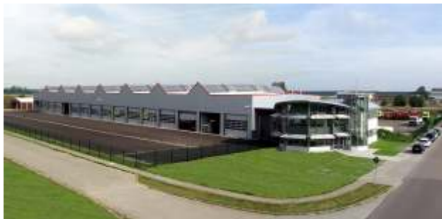
Hauptwerk Deutschland, Elster