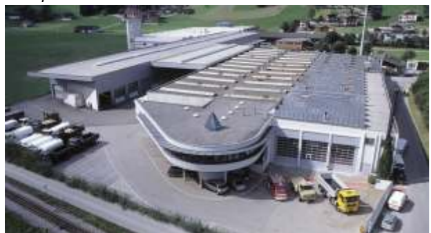
Hauptwerk Österreich, Kaltenbach