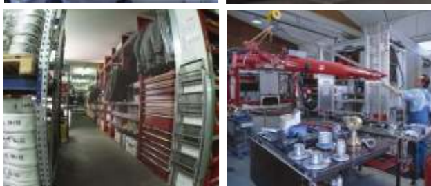
Modernste Fertigungstechnologien für weltweit anerkannte Qualitätsprodukte von der Planung bis zur Auslieferung